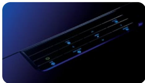
Teclado LiteTouch de InFocus

El elegante panel de control con iluminación trasera LiteTouch ofrece a las funciones del proyecto de uso más común con un solo toque.