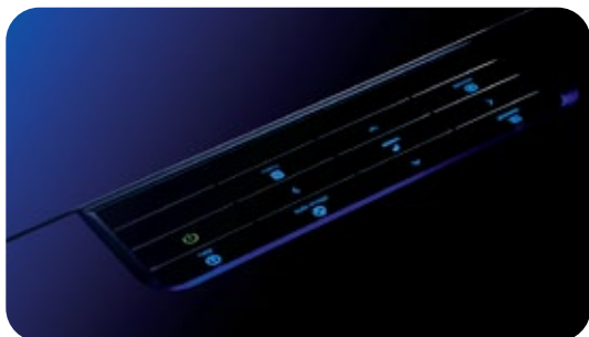
Tastiera InFocus LiteTouch

L'elegante pannello di comando retroilluminato LiteTouch consente di accedere con una semplice pressione alle funzioni più usate del proiettore.